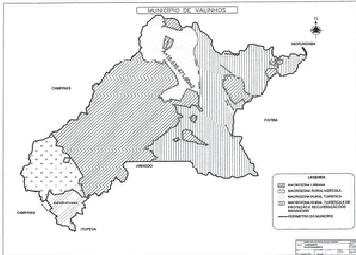
Figura 1 – Áreas urbanas isoladas do município

considerar como diretriz principal do PD III a abertura franca de frentes de urbanização sobre áreas anteriormente rurais ou de preservação ambiental para reserva hídrica, com grande ênfase a empreendimentos residenciais na forma de condomínios horizontais ou de baixa verticalização, além da instituição de mais uma zona urbana isolada para pretensos estabelecimentos de logística. Os efeitos dessa expansão urbana dispersa estimulada pelo PD III podem ser verificados “in loco” no território do município pela mancha urbana estendida e rarefeita em todas as direções, mas, certamente, a averiguação precisa das economias e deseconomias geradas por esse crescimento urbano carece de ser processada para uma avaliação integrada de resultados e o redelineamento de metas e objetivos futuros de fato comprometidos com uma cidade inclusiva, de gestão racional.